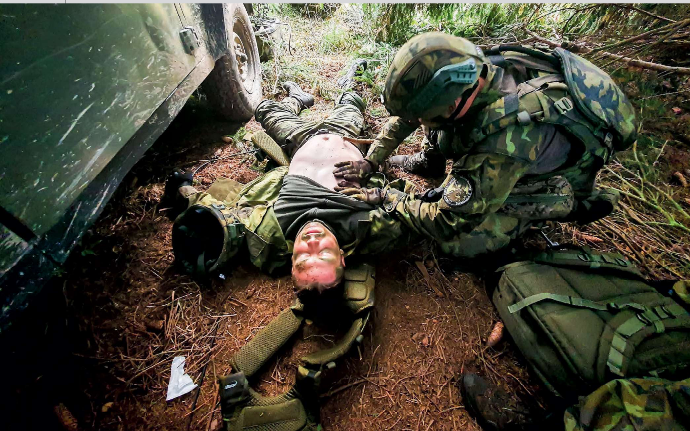
Jeden ze simulovaných incidentů – ošetření zraněného vojáka

přivedla touha po změně, zajímavé práci a možnost osobního rozvoje.