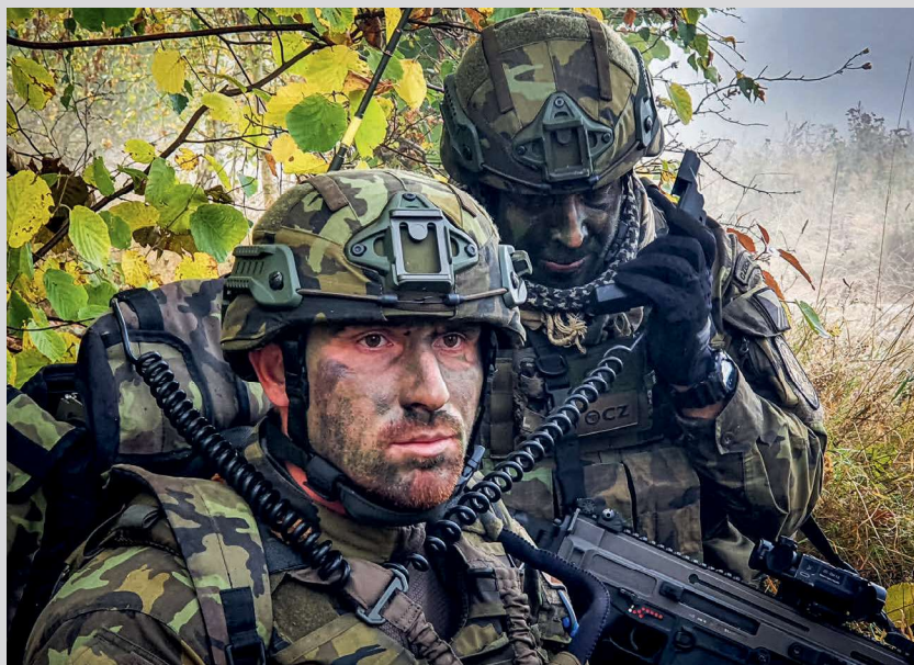
Jednotka je ve spojení s nadřízeným stupněm.

Intenzivní příprava vojáků do zahraniční operace bude probíhat až do konce roku. „Čekají nás štábní návčiky, jež budou zaměřené na prohloubení schopností příslušníků štábu. Dále musíme doladit dokumentaci a jednotka se bude připravovat na závěrečnou kontrolu,“ doplnil major Růžička. Několik vojáků pojedje do Litvy na stáž, aby